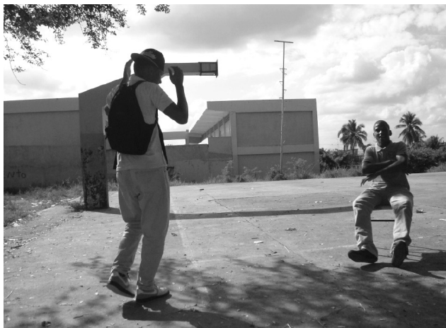
Figura 2. Jóvenes dominicanos fuera de su centro público de un barrio de Santo Domingo