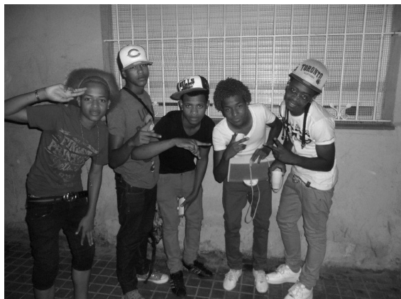
Figura 1. Jóvenes dominicanos de la periferia de Barcelona