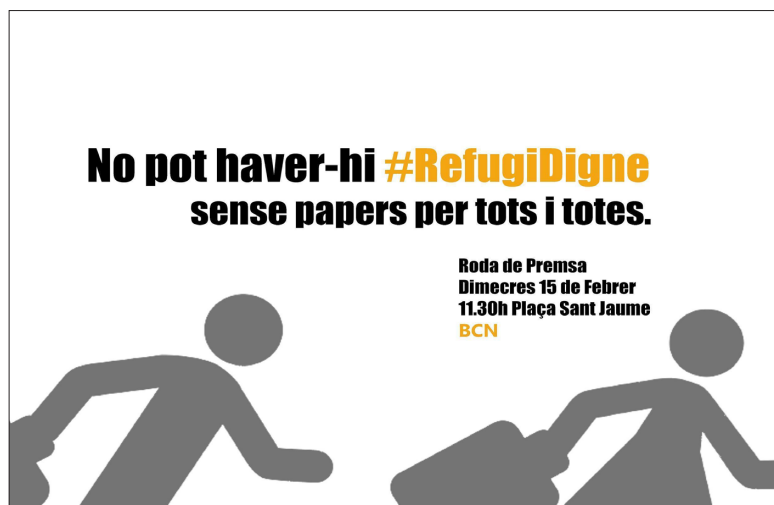
Imagen 2: Cartel difundido en redes sociales para la Rueda de Prensa #RefugiDigne. (En castellano, “No puede haber #RefugioDigno sin papeles para todos y todas”)

El 15 de febrero de 2017, dos días antes de la gran manifestación “Volem Acollir” con la que concluye la campaña CNCV, se convoca una rueda de prensa en la céntrica Plaça Sant Jaume de Barcelona. Acompañado de un colectivo activista, un grupo de solicitantes de asilo denuncia lo que consideran son una serie de carencias con respecto a su experiencia dentro del SAPI. La rueda de prensa se realiza precisamente por su proximidad con el colofón final de la campaña. Convocada bajo el hashtag #RefugiDigne, representa una disonancia con respecto al ambiente general de gran expectación: frente a la imagen de una sociedad que se muestra dispuesta a “acoger personas refugiadas”, un grupo de estas mismas personas que ya residen en el SAPI denuncia que estos sentimientos generales en la opinión pública no se traducen en una atención digna. Esta disonancia está también contenida en uno de los carteles que circula en redes sociales para la convocatoria de esta rueda de prensa (Imagen 2), y que tendrá también su eco en una parte de los participantes de la gran manifestación del día 17 de febrero.