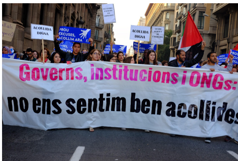
Imagen 3: El autodenominado Bloque Migrante en la manifestación “Volem Acollir” del 17 de febrero de 2017. Encabezando la sección, una pancarta en la que se lee “Gobiernos, instituciones y ONGs: no nos sentimos bien acogidas”.

mundo editorial anglosajón, y a la que recientemente se han añadido más referencias en castellano (Cordero et al., 2019; Mezzadra y Nielson, 2017, entre otras). Muy resumidamente, podríamos describir la AdM como una perspectiva que propone un acercamiento epistemológico a las migraciones más allá de su consideración como un mero resultado de determinantes políticos o económicos. Al contrario, se la considera como un movimiento social en sí misma, preguntándose por tanto por las formas en las que esta actúa para transformar las sociedades en las que se enmarca y los sistemas de control migratorio que buscan restringirla o redirigirla.