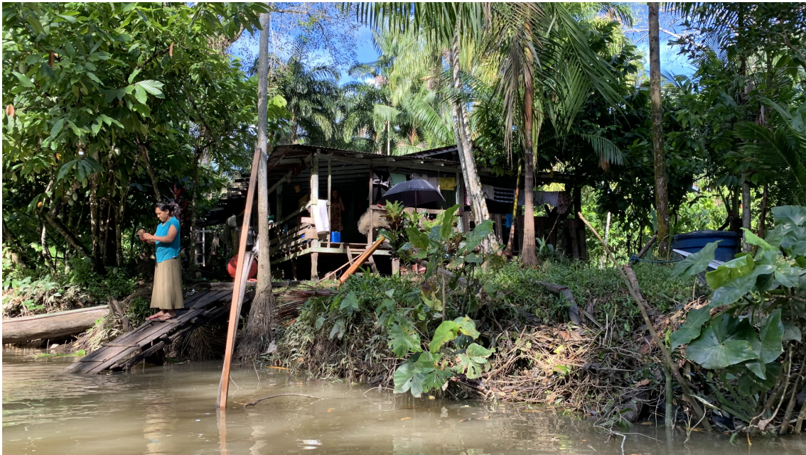
Il·lustració 5. Entorn domèstic en la vora costanera de l'illa del Combu.

Pel que fa a la modernitat de les illes i dels cabocles, el riu és la matriu de la temporalitat dels ritmes socials, fent i desfent centralitats amb dinàmiques específiques. A l'illa del Combu es viu el riu com a font de recursos, però també com a carrer i espai públic; és a dir com a espai de construcció social (Montoia i Da Costa, 2019). Les pràctiques culturals es van transformant, però el riu es manté, per molt que paradoxalment sigui per definició una realitat en flux constant. Aquestes dinàmiques evidencien a l'Amazònia urbana la conflictiva relació entre la ciutat concebuda per la tecnocràcia i la ciutat viscuda per les persones.