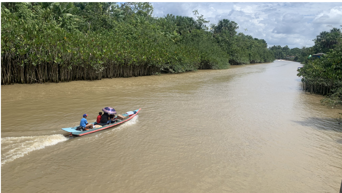
Il·lustració 6. Ús de rutes fluvials.

Com poden les diferents formes de vida ribeirinha trobar una manera de coexistir amb les dinàmiques d'incorporació als processos de mundialització, convertint la seva tradició i els seus modus de supervivència en elements adaptatius? Totes aquestes qüestions es sintetitzen en una: Què es pot aprendre sobre la modernitat des d'una perspectiva subalterna i prenent com a model etnogràfic el coneixement d'una comunitat ribeirinha en un context urbà amazònic?