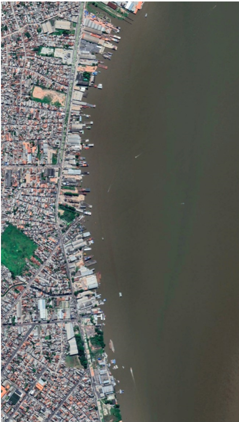
Il·lustració 2: Captura de Google Earth on es pot veure la riba del riu a la part continental del municipi de Belém.

Com a resultat, aquest model d'ocupació provoca un moviment migratori de persones del nord-est i sud del país cap a la regió nord, el que va significar un ràpid creixement urbà de la regió metropolitana de Belém, d'entre altres, obligant part de les comunitats autòctones a traslladar-se de les regions rurals a la perifèria de les metròpolis. En la Belém continental, aquest moviment va donar lloc a assentaments urbans amb infraestructures deficientes, on bona part de les poblacions —autòctones i emigrants— acaben esdevenint comunitats marginades, vivint en condicions precàries (Schor et al., 2018). Ja en la Belém insular, les comunitats han mantingut una dinàmica fortament relacionada amb la forma de vida tradicional amazònica, basada en sistemes de plantació de cultius, caça i pesca.