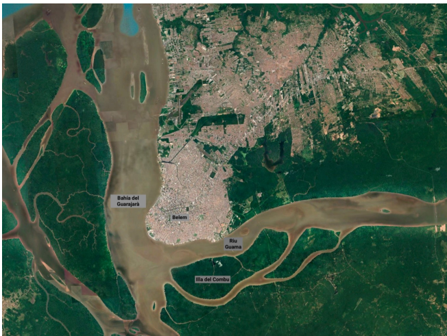
Il·lustració 1: Captura de Google Earth on es pot veure Belém, l'illa de Combu i algunes altres illes.

L'illa del Combu forma part de Belém, una ciutat amb aproximadament 1.500.000 habitants que representa la segona ciutat més gran de la regió nord del Brasil després de Manaus. El municipi es troba al bioma amazònic, més exactament a l'estuari del riu Amazonas, amb la influència de l'oceà Atlàntic. La ciutat té una àrea d'influència de dues conques hidrogràfiques i el 65% del seu territori està format per una porció insular, composta per entre 39 i 42 illes segons la variació del nivell de l'aigua. La de Combu és la quarta més gran d'aquestes illes, amb una superfície total de 15.972 km 2 . La seva població 2 és majoritàriament cabocla (mestissos de blancs amb indígenes), però amb una forta presència de quilomboles 3 i emigrants. Es tracta d'una població típica d'illencs o ribeirinhos 4 , és a dir, illencs, perquè són persones que diuen haver nascut en una regió d'illes, i ribeirinhos perquè viuen a la vora del riu a zones de planes inundables 5 .