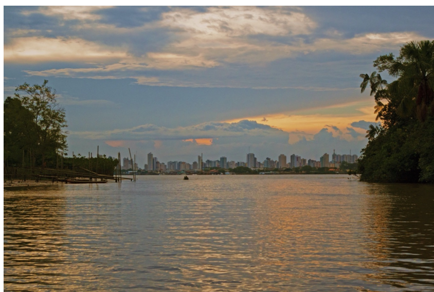
Il·lustració 4. Imatge de Belém, des d'una comunitat de l'illa del Combu.

Aquesta Amazònia urbana, i en concret la viscuda per les comunitats ribeirinhas que viuen a les ribes del Guama a l'illa de Combu, permeten, primer, reflexionar sobre la construcció de la ciutat des de la perspectiva dels subjectes i agents (resistents i marginals), amb la seva particular experiència subjectiva per a la construcció de noves geografies urbanes. I, segon, entendre la mobilitat com un fenomen més ampli que el relatiu al mer desplaçament dels humans d'un punt a un altre.